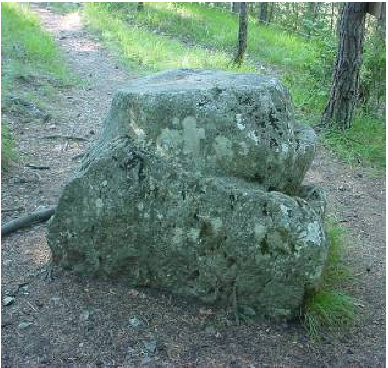
La Pierre des sacrifices

La pierre des sacrifices se trouve à proximité de la ville de Mens, dans le Trièves. C'est un gros bloc de pierre que certains comparent à un menhir. Sa partie supérieure est plate, horizontale et sur le pourtour, une rainure est taillée dans la masse. La légende raconte qu'au temps des gaulois, les druides après la traditionnelle cueillette du gui au nouvel an, procédaient à des sacrifices humains ou d'animaux pour plaire aux dieux qu'ils vénéraient à cette époque. Le sang s'écoulait sur le bord par la fameuse rainure.